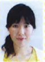
中央労働安全衛生協会