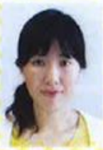
中央労働災害防止協会