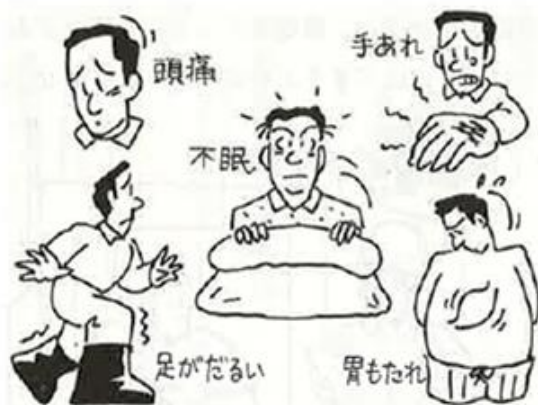
有機溶剤による健康障害

これが作業主任者の職務 選任した作業主任者に 災害防止のための本来の 職務を行わせよう。